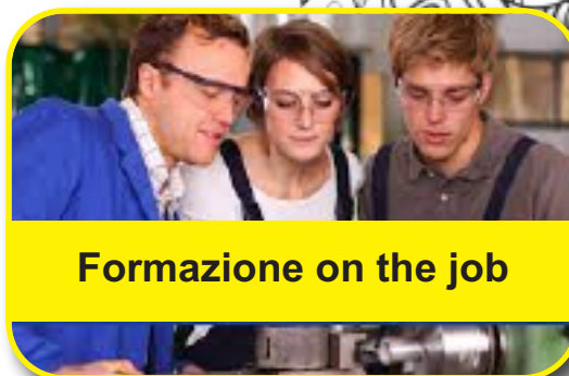
Formazione on the job